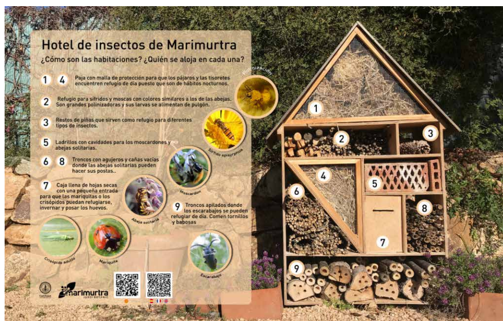
Imatge de Marimurtra. El Jardí Botànic de la Costa Brava.

Per decidir quina elements i material hi col·loquem es pot fer recerca de quines necessitats té cada cuca.